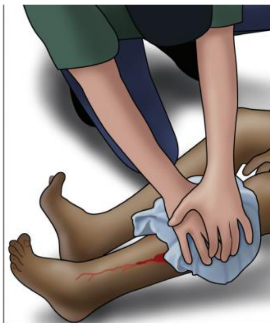
Рис. 1. Тиск на рану, що кровоточить [Peter T. Pons, Lenworth Jacobs. What Everyone Should Know to Stop Bleeding After an Injury. American College of Surgeons, 2017. P. 10]

Доктор філософії, асистент кафедри дитячих хвороб ЗДМУ, дитячий анестезіолог 1-ї категорії Городкова Юлія Вячеславівна